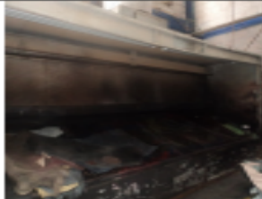
FOTOGRAFÍA 9. CABINA DE PINTURA 1