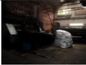
FOTOGRAFÍA 7. PROCESO DE TEÑIDO