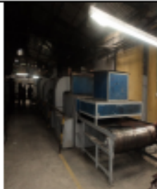
FOTOGRAFÍA 11. TUNEL DE SECADO