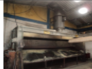
FOTOGRAFÍA 10. CABINA DE PINTURA 2