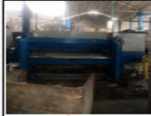
FOTOGRAFÍA 6. DIVIDIDORA