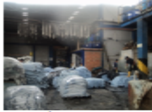
FOTOGRAFÍA 5. PIELS CURTIDAS