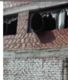
FOTOGRAFÍA 14. DUCTO CABINA DE PINTURA 1