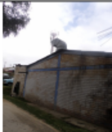
FOTOGRAFÍA 13. DUCTO CABINA DE PINTURA 2