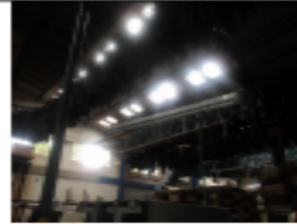
FOTOGRAFÍA 8. BANDAS DE SECADO