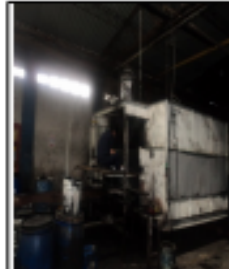
FOTOGRAFÍA 12. TEÑIDO